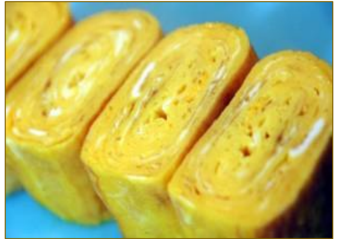
あまりかき混ぜない厚焼きたまご